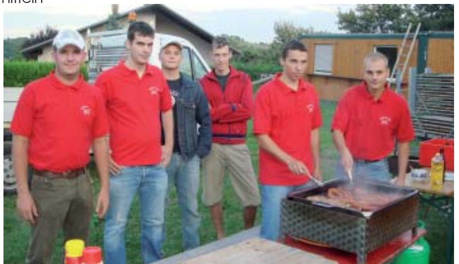
Großes Angebot für die Wiesener Jugend

Tanzkurs - für Jugendliche Jugendförderung für Nachwuchsmannschaften des SC, Judo, Tennis, usw.