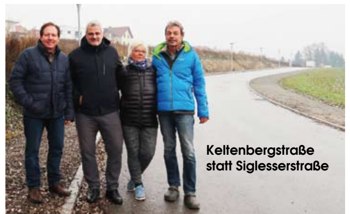
Keltenbergstraße statt Siglessersstraße

Die neu asphaltierte Straße bei den Kardea-Grundstücken (früher Siglessersstraße) erhielt vom Gemeinderat den Namen „Keltenbergstraße“. Der Gehsteig auf der oberen Seite der Straße wird infolge der Bauarbeiten bei den Wohnhäusern innerhalb von zwei Jahren fertiggestellt.