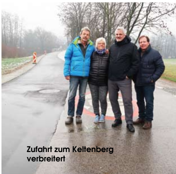
Zufahrt zum Keltenberg verbreitert

Für den Kindergarten wurden im Budget EUR 36.000,-- reserviert. Für die Volksschule wurden EUR 42.000,-- mit der Nachmittagsbetreuung budgetiert.